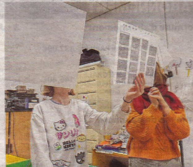
Les jeunes ont appris à photographier au rythme de l'argentique.